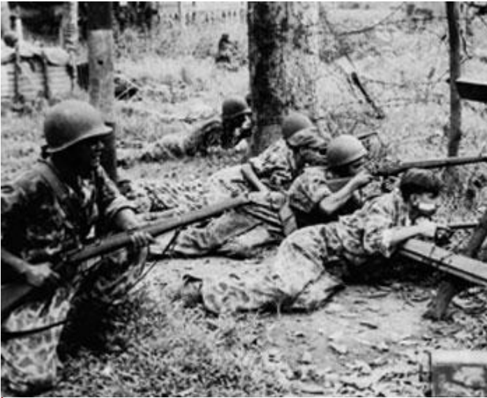
Figuur 3: De politionele acties.

slechte timing. De tweede grote militaire actie, Operatie Kraai, bracht het er veel slechter vanaf dan Operatie Product. De politieke elite van de Republiek werd gepakt, maar de militaire leiding bleef uit Nederlandse handen en wist zelfs een schaduwstaat te organiseren. Tevens wist een beter aangestuurde TNI een aanvankelijk beperkt maar gestaag oplopend aantal Nederlandse slachtoffers te verwezenlijken, met als gevolg een toenemende druk op het moreel. Dankzij de hervormingen van Nasution werd de TNI een steeds gevaarlijkere gevechtsgroep die daadwerkelijk schade kon toebrengen aan de Nederlandse positie.