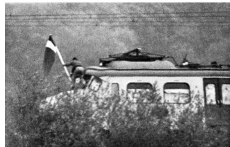
Figuur 2: Op 23 mei 1977 om negen uur 's morgens wordt de intercity Assen-Groningen, bij de spoorwegovergang De Punt, door negen gewapende Zuid-Molukse jongeren gekaapt en tot stilstand gebracht. Tegelijkertijd begint een gijzeling van een lage school in Bovensmilde van 105 kinderen en 5 onderwijzers.

Op 22 november 1978 dechargeerde viceminister-president Wiegel per brief 'tot zijn spijt' de leden van de Commissie. 17 Hij bedankte hen voor de zo 'gewaardeerde werkzaamheden.' Köbben zag de opdoeking van de Commissie anders en noemde het 'a blessing in disguise.' Van een afscheidsborrel, die was aangeboden door Wiegel, zagen de leden af. De Commissie van Overleg Zuid-Molukkers-Nederlanders stierf zo een stille dood.