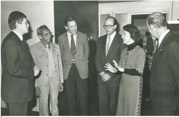
Figuur 3: Een kabinetsdelegatie en leden van de Commissie Köbben-Mantouw. V.l.n.r. minister Wiegel, voorzitter Mantouw, voorzitter Köbben, en de ministers De Ruiter (Justitie), Gardeniers (CRM) en Van der Klaauw (Buitenl. Zaken). 16 maart 1978

archieven, maar het onderzoek kon pas medio 1977 aanvangen. De oorzaak hiervan was dat het meer dan een jaar had geduurd voordat de minister-president de financiële medewerking had verleend die nodig was om onderzoekers aan te trekken. Het onderzoek zou uiteindelijk in 1981 uitgebracht worden.