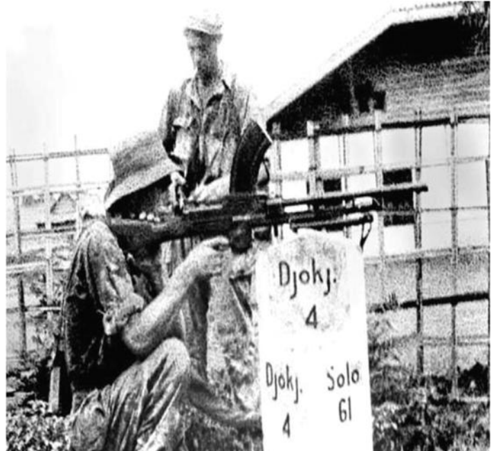
Figuur 1: Nederlandse troepen onderweg naar Surakarta tijdens de 2e positionele actie.

De uiteindelijke onafhankelijkheid van Indonesië betekende een militair verlies voor Nederland. Het is alom bekend dat Nederland zwaar materieel en een grote troepenmacht heeft ingezet in die militaire strijd. Hoe kan het dan dat Nederland de oorlog toch heeft verloren? Dit fenomeen, waarbij de zwakker geachte partij wint van de sterkere, is inmiddels een populair onderwerp in militaire studies. 2 Hoewel er brede, complexe en zeker ook unieke factoren ten grondslag liggen aan dit proces, is dit artikel hoofdzakelijk gericht op de militaire oorzaken. Er zal dus gekeken worden naar de strategie en tactiek van beide partijen, 3 de effectiviteit ervan en de gevolgen. Ook meegenomen wordt het element van inheemse steun. (Inter) nationale steun is namelijk essentieel in elk conflict. Als de bevolking niet overtuigd kan worden van een dominante partij, is de kans groot dat een conflict zal blijven voortduren. 4 Steun van buitenlandse partijen is ook belangrijk, maar zal om praktische redenen in dit artikel niet meegewogen worden als factor. 5 Dit wil dus niet zeggen dat dit element niet wordt erkend.