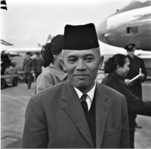
Figuur 2: Generaal Nasution.

gekregen. Tot slot was de lokale bevolking gemobiliseerd om hen te steunen op het moment dat er weer een militaire ingreep zou uitbreken. 46 Die steun ging zo ver dat er zelfs munitie en wapens geleverd werden uit Nederlandse wapenfabrieken op West-Java. Dit werd in dit geval mogelijk gemaakt doordat de loyaliteit van enkele arbeiders, vrijwel altijd bestaande uit inheemse mensen, niet aan Nederland was, maar aan de TNI. 47