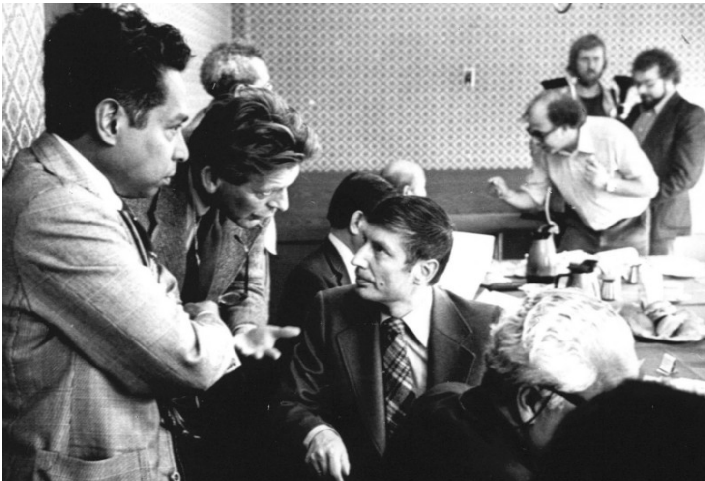
Figuur 1: De foto werd genomen op 12 juni 1977. De oorspronkelijke ondertitel luidt: 'Zondagochtend is in Utrecht een bijeenkomst gehouden van de adviescommissie van de Nederlandse regering voor overleg tussen Zuid-Molukkers en Nederlanders. De bijeenkomst werd o.a. bijgewoond door minister Van Agt, die wij hier in gesprek zien met de heren Köbben en Mantouw van de Commissie.'

In 2009 werd een aantal archieven van het ministerie van Justitie overgedragen aan het Nationaal Archief. Een van deze archieven omvatte de aantekeningen en notulen van de Commissie van Overleg (1976-1978). 1 Op basis van archiefonderzoek zal in dit artikel de houding van de Nederlandse regering ten opzichte van deze commissie geanalyseerd worden.